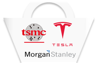
ตะกร้าที่ 5

ผู้ลงทุน “โปรดทำความเข้าใจลักษณะสินค้าเงื่อนไขผลตอบแทนและความเสี่ยงก่อนตัดสินใจลงทุนและควรขอคำแนะนำเพิ่มเติมจากบริษัทจัดการหรือผู้แนะนำการลงทุนก่อนทำการลงทุน” โดยเฉพาะส่วนที่ลงทุนในต่างประเทศกองทุนมีนโยบายป้องกันความเสี่ยงจากอัตราแลกเปลี่ยนตามดุลพินิจผู้จัดการกองทุนเนื่องจากกองทุนไม่ได้ป้องกันความเสี่ยงจากอัตราแลกเปลี่ยนทั้งจำนวน ผู้ลงทุนอาจขาดทุนหรือได้รับกำไรจากอัตราแลกเปลี่ยนหรือได้รับเงินคืนต่ำกว่าเงินลงทุนเริ่มแรกได้ สอบถามรายละเอียดเพิ่มเติมและขอรับหนังสือชี้ชวนได้ที่บริษัทหลักทรัพย์จัดการกองทุน แอสเซท พลัส จำกัด