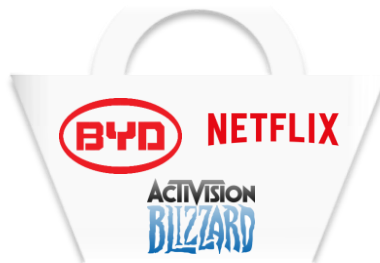
ตะกร้าที่ 4